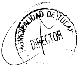
FRANCISCO JAVIER DUEÑAS AGUAYO ALCALDE (S)