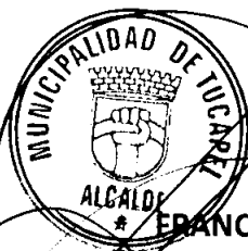
FRANCISCO JAVIER DUEÑAS AGUAYO ALCALDE (S)