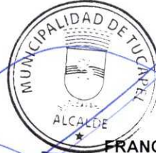
FRANCISCO JAVIER DUEÑAS AGUAYO ALCALDE (S)