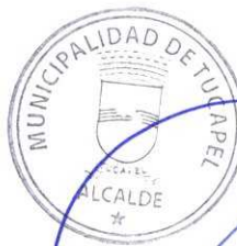
FRANCISCO JAVIER DUEÑAS AGUAYO ALCALDE (S)