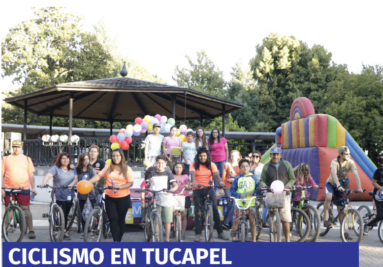
CICLISMO EN TUCAPEL