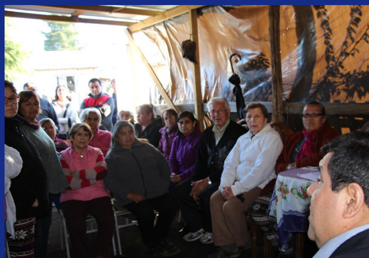
COMITÉ EN NUEVO AMANECER