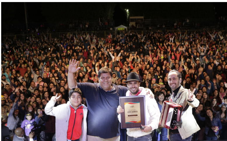
FESTIVAL ARCOÍRIS DE HUÉPIL