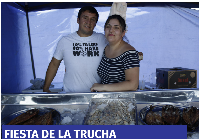
FIESTA DE LA TRUCHA