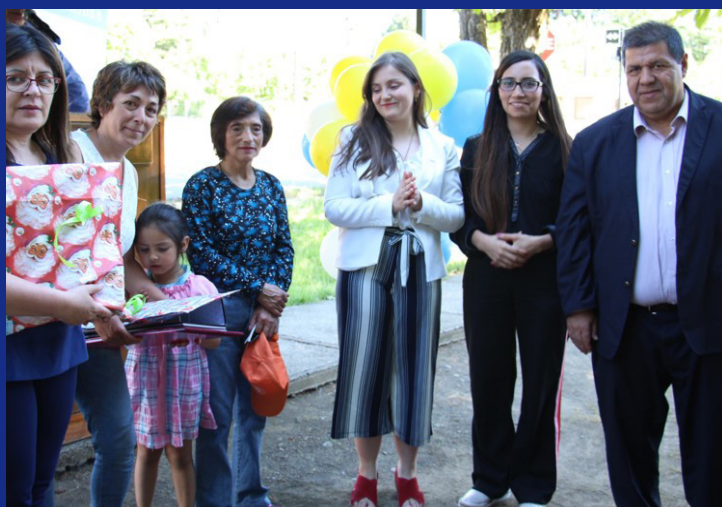
COMITÉ DE SEGURIDAD POLCURA