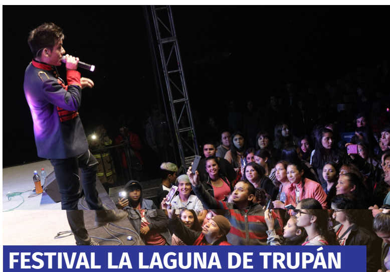
FESTIVAL LA LAGUNA DE TRUPÁN