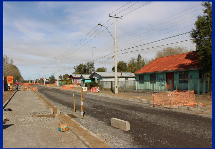
AVENIDA O´HIGGINS TENDRÁ CICLOVÍA

La avenida O´Higgins se está remodelando desde San Diego hasta calle Esmeralda.