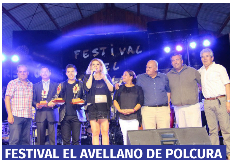
FESTIVAL EL AVELLANO DE POLCURA