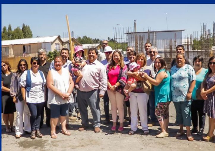
NUEVAS SALAS CUNAS Y JARDINES INFANTILES

Es necesario destacar que esta intervención contempla sólo obras de mejoramiento, por lo que se conservarán los trazos existentes, así como también los árboles que dan vida a la Plaza de Huépil.