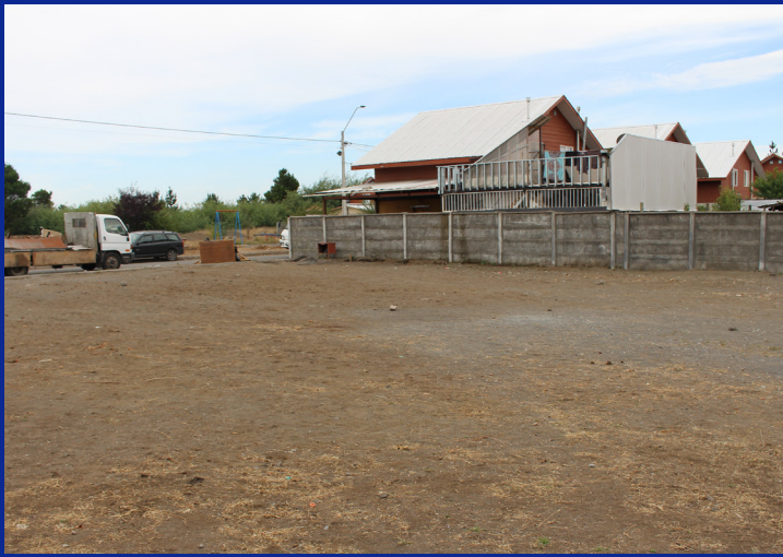
VILLA NUEVO AMANECER ANTES