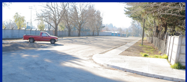
AUMENTA PAVIMENTACIÓN DE CALLES

Con rapidez se avanza en la construcción de nuevas vías pavimentadas. Las calles: Covadonga, Estadio, Los Lagos y Esmeralda se ejecutan con el Programa de Pavimentación Participativa del Serviu.