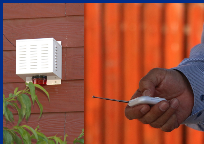
BOTONES DE SEGURIDAD EN TUCAPEL