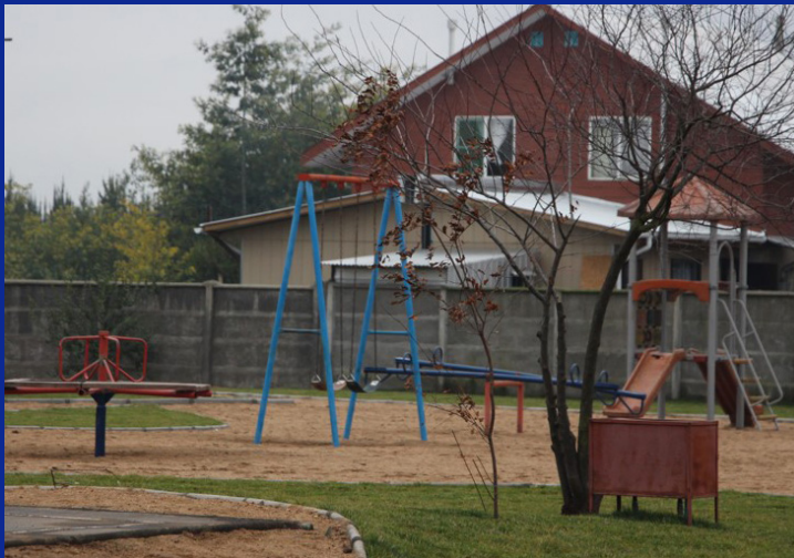
VILLA NUEVO AMANECER AHORA

Vecinos y vecinas de la Villa Nuevo Amanecer recibieron su nueva plaza totalmente refaccionada, todo gracias al proyecto municipal aprobado por la Subsecretaría de Prevención del Delito. Este era un sitio eriaz, foco de delincuencia y vandalismo que impedía que las familias tuvieran una vida tranquila.