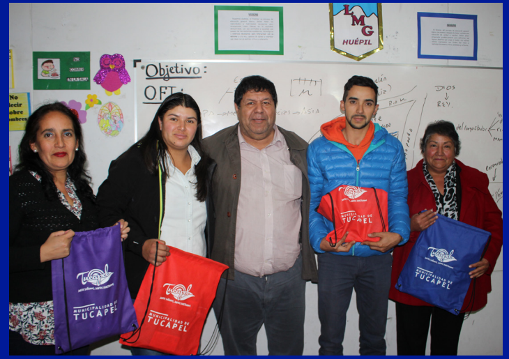
NIVELACIÓN DE ESTUDIOS