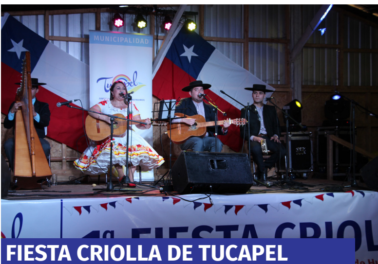
FIESTA CRIOLLA DE TUCAPEL