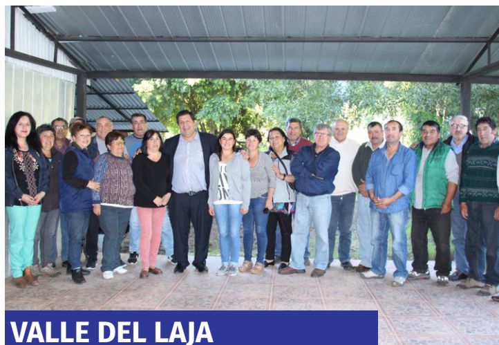
VALLE DEL LAJA