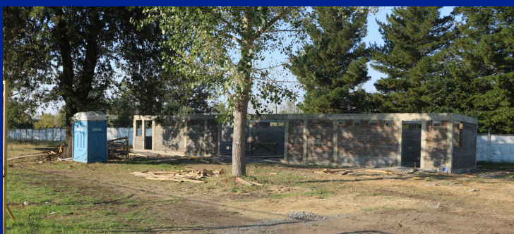
CONSTRUCCIÓN DE CAMARINES EN ESTADIO

La plaza cuenta con buena iluminación, basureros nuevos, máquinas para hacer ejercicio, pasto, pavimento y multicancha.