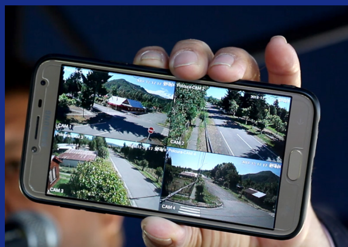
CÁMARAS DE VIGILANCIA POLCURA

Las cámaras pueden ser monitoreadas a través de los celulares de los vecinos. De la misma forma, se instalaron alarmas y botones de pánico en la población Nuevo Amanecer de Tucapel.