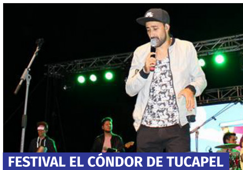
FESTIVAL EL CÓNDOR DE TUCAPEL