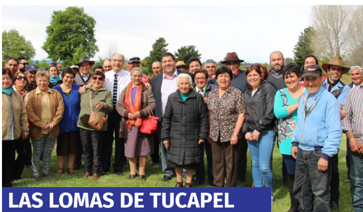
LAS LOMAS DE TUCAPEL